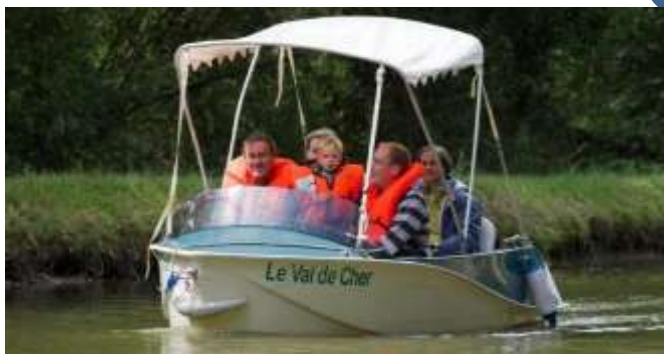
Navigation sur le canal de Berry