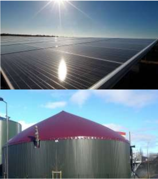
Solaire et biomasse

L'objectif est que cet espace devienne le site d'une production combinée d'énergies renouvelables à partir du solaire et de la biomasse.