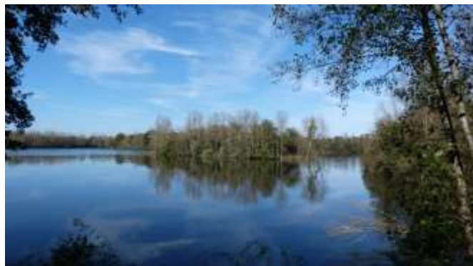
L'espace naturel sensible de la Vauvre

Le site de la Vauvre donne aussi son nom à l'Espace Naturel Sensible que la communauté des sept communes gère, entretient et anime avec la ressource des savoirs et savoir-faire de la Ligue Protectrice des Oiseaux (LPO) : l'espace préservé est aquatique, ornithologique et propice à la biodiversité. Le décor est sauvage et cependant destiné au public avec des sentiers aménagés et des équipements discrets d'observation et de découverte.