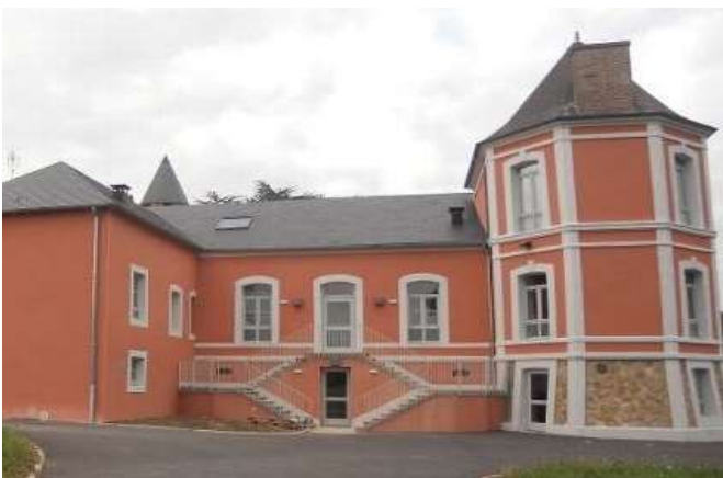
Centre de loisirs à Vaux

En direction de l'enfance et de la jeunesse. La communauté des sept communes du Val de Cher investit et s'investit pour les enfants et les jeunes du territoire. Elle gère deux centres d'animation , en régie directe sur la commune de Vaux et par délégation au centre social (Pays Tronçais- Val de Cher) pour celui situé à Vallon.