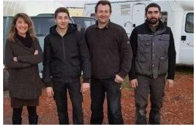
En équipe et en famille à l'atelier mécanique et carrosserie