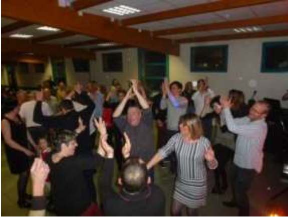
Tous à la fête, à Maillet

l'appareil électrique faisait converger autant les rires et les conversations que les bras qui se tendent pour faire fondre et dorer le fromage.