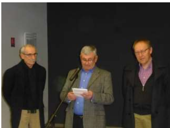
Vœux du maire de Haut-Bocage