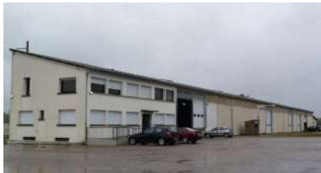
Gîte d'entreprises à Estivareilles

En matière d'économie et d'aménagement de l'espace. A Estivareilles, les Ateliers communautaires du Val de Cher sont à la disposition des artisans ou PME qui cherchent des mètres carrés pour leurs activités et/ou le stockage de leurs matériaux et matériels.