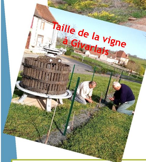
Taille de la vigne à Givarlais