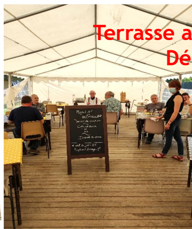
Terrasse au restaurant Délicatessen