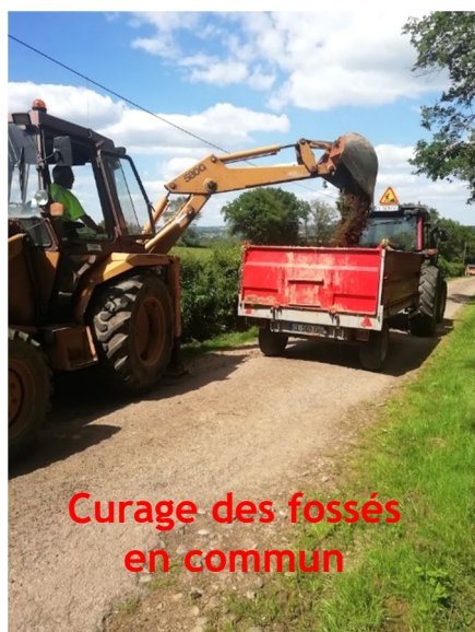
Curage des fossés en commun