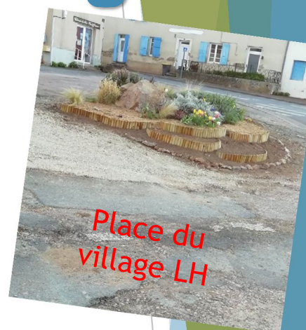
Place du village LH